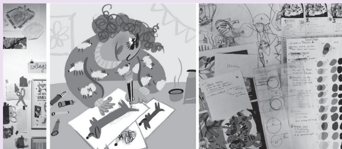
il·lustració: Marina Saez