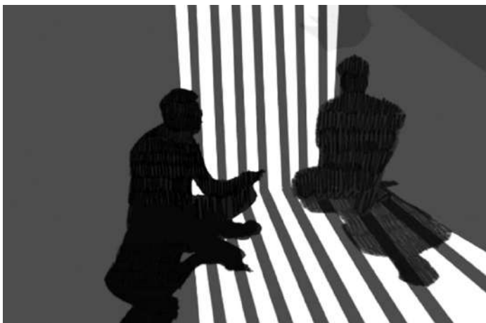
Fotografía: Mujer Pantera