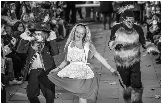
Fotografia: Guanyadors del concurs de disfresses '24